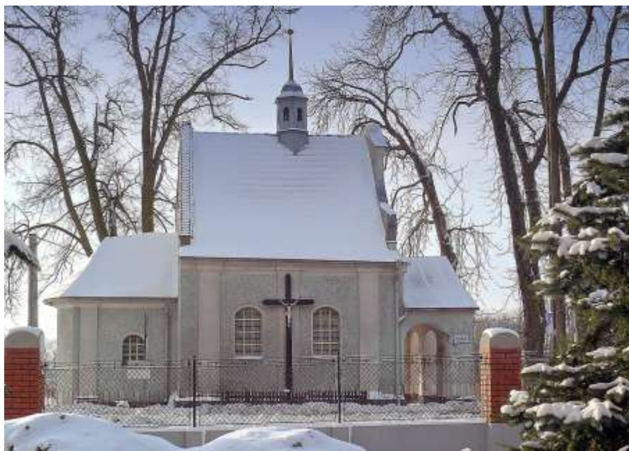
Trinitatiskapelle - gegenüber dem Krankenhaus - Dezember2010