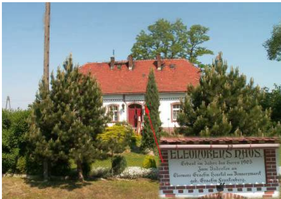
Kaulwitz - Eleonorenhaus