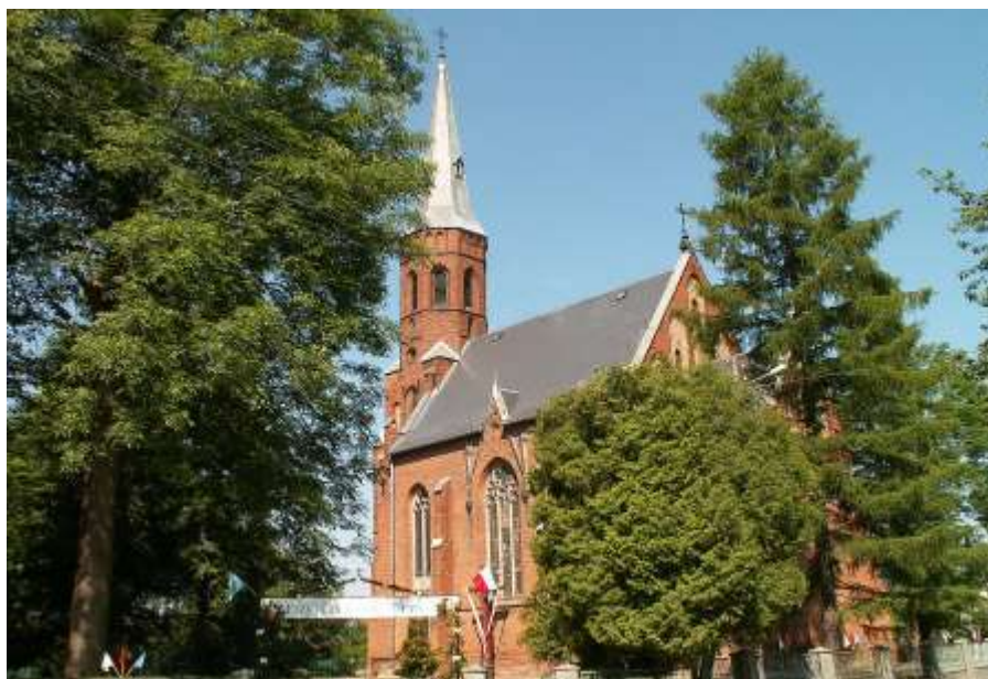
Kaulwitz - Kirche