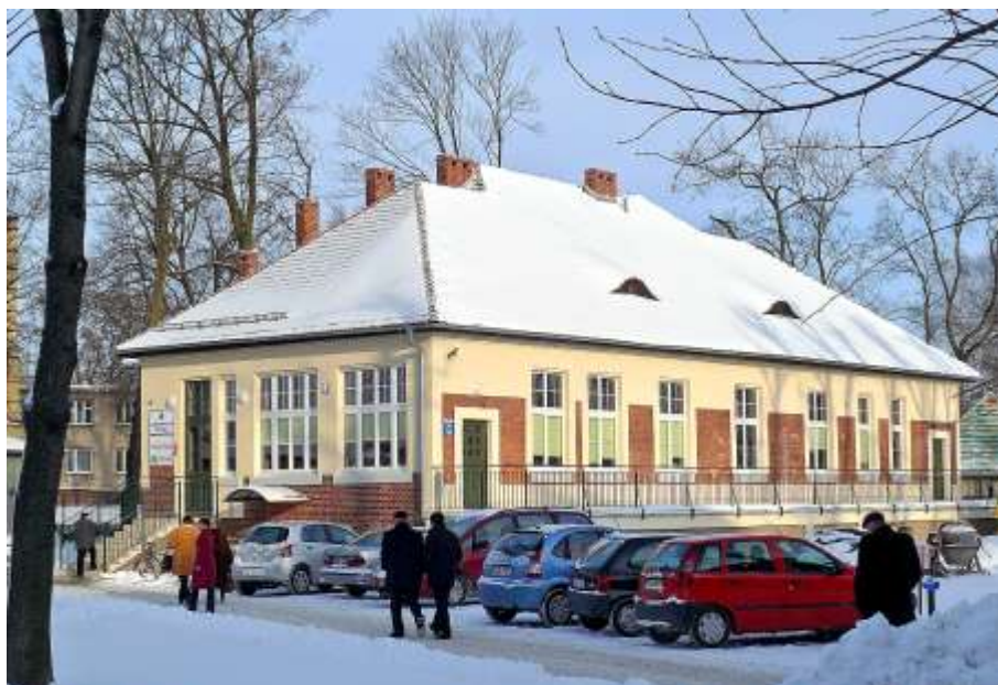
Das neue Verwaltungsgebäude des Krankenhauses